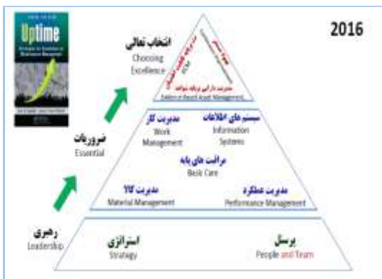
شکل ۱- الگوی مدیریت دارایی‌ها

مدیریت دارایی ۲ : دارایی یک عنصر، شیء یا موجودیت است که ارزشی محتمل یا واقعی برای یک سازمان دارد. ارزش در میان سازمان و ذینفعان آن‌ها متغیر خواهد بود و می‌تواند محسوس یا نامحسوس، مالی و یا غیر مالی باشد. مدیریت دارایی در دستیابی به اهداف سازمانی، سازمان را قادر به تحقق ارزش از سمت دارایی‌ها می‌کند. آنچه به منزله ارزش است، به این اهداف، ماهیت و هدف سازمان و نیازها و انتظارات ذینفعان آن بستگی دارد (کرسپو مارکر، ۱۳۹۳: ۳۸۲).